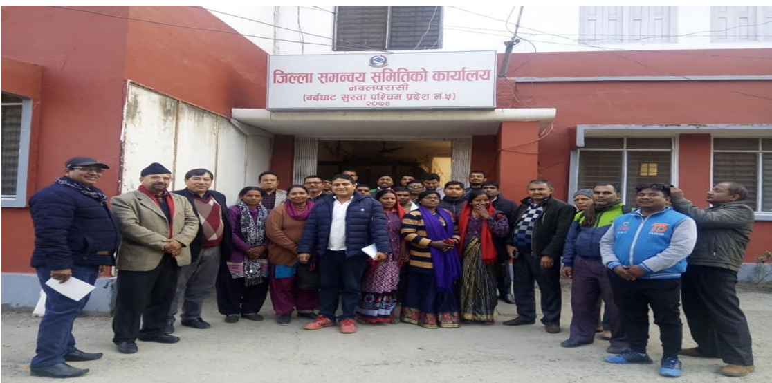
पदाधिकारी तथा कर्मचारी, सकारात्मक सोच तथा तनाव व्यवस्थापन तालिम पश्चात सामुहिक फोटो सुटमा